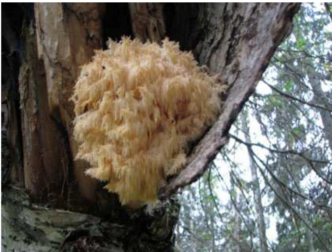
Рис. 3. Hericium coralloides на стволе Betula pubescens (р. Вама)

дальнейших исследований, список видов афиллофороидных грибов, встречающихся на островах, может быть расширен.