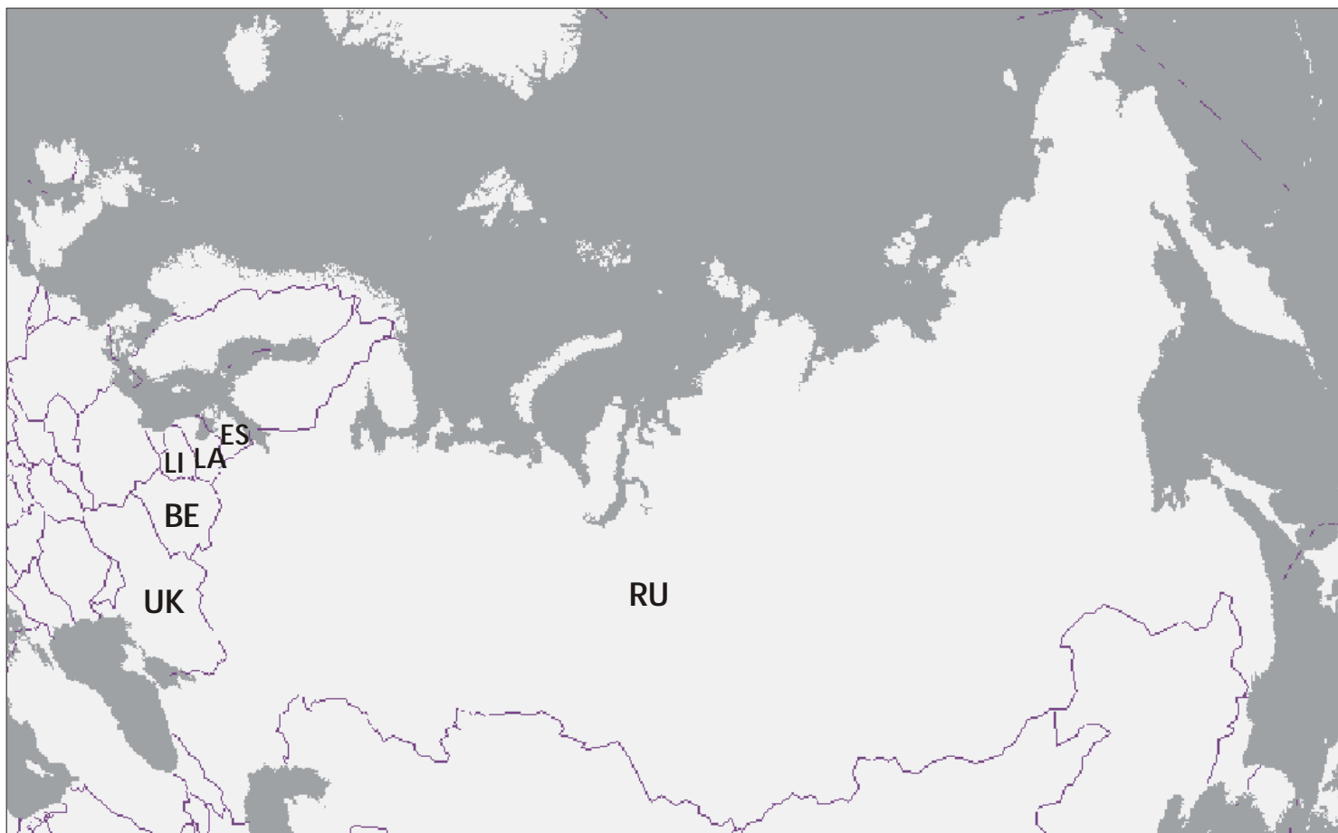
Политическая карта территории: Эстония, Латвия, Литва, Беларусь, Украина, Россия. Politic map of the region: Estonia, Latvia, Lithuania, Belarus, Ukraine, Russia